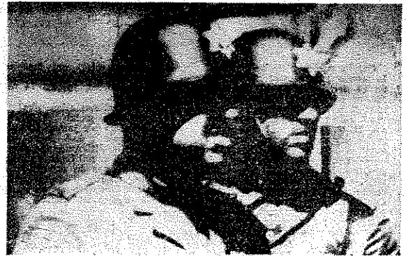
La PIDE police politique portugaise n'a rien à envier aux méthodes de la gestapo allemande.

En janvier 1962 a eu lieu la révolte armée de Beja à laquelle de nombreux civils ont participé. Cet événement a renoué le pays en dépit de l'échec de l'assaut de la caserne, et, peu après, les grandes manifestations de mai à Lisbonne, ont confirmé la disposition du