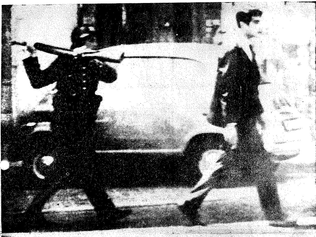
A Lisbonne, les manifestations sont brutalement réprimées — avec une complaisance et un acharnement certains.

Car la misère n'atteint pas tout le monde ; le revenu moyen par an et par habitant est d'environ 100.000 anciens francs ; mais ce n'est là qu'une moyenne : un ouvrier agricole ne gagne pas plus de 72.000 francs par an, 6.000 francs par mois ; quand eux banques et aux grandes compagnies industrielles, elles font, elles, des profits substantiels : 26 % du capital, pour les banques, 19 % du capital investi pour les industries. Ces profits sortent en notable proportion du Portugal, et vont augmenter les revenus des compagnies monopolistes ; la part de profit qui reste au pays va enrichir encore la poignée de grands bourgeois et de féodaux dont le régime Salazar est le garant. La part de revenu national qui revient chaque année aux classes travailleuses est de 39 % ; les détenteurs de capital s'octroient le reste, 61 %.